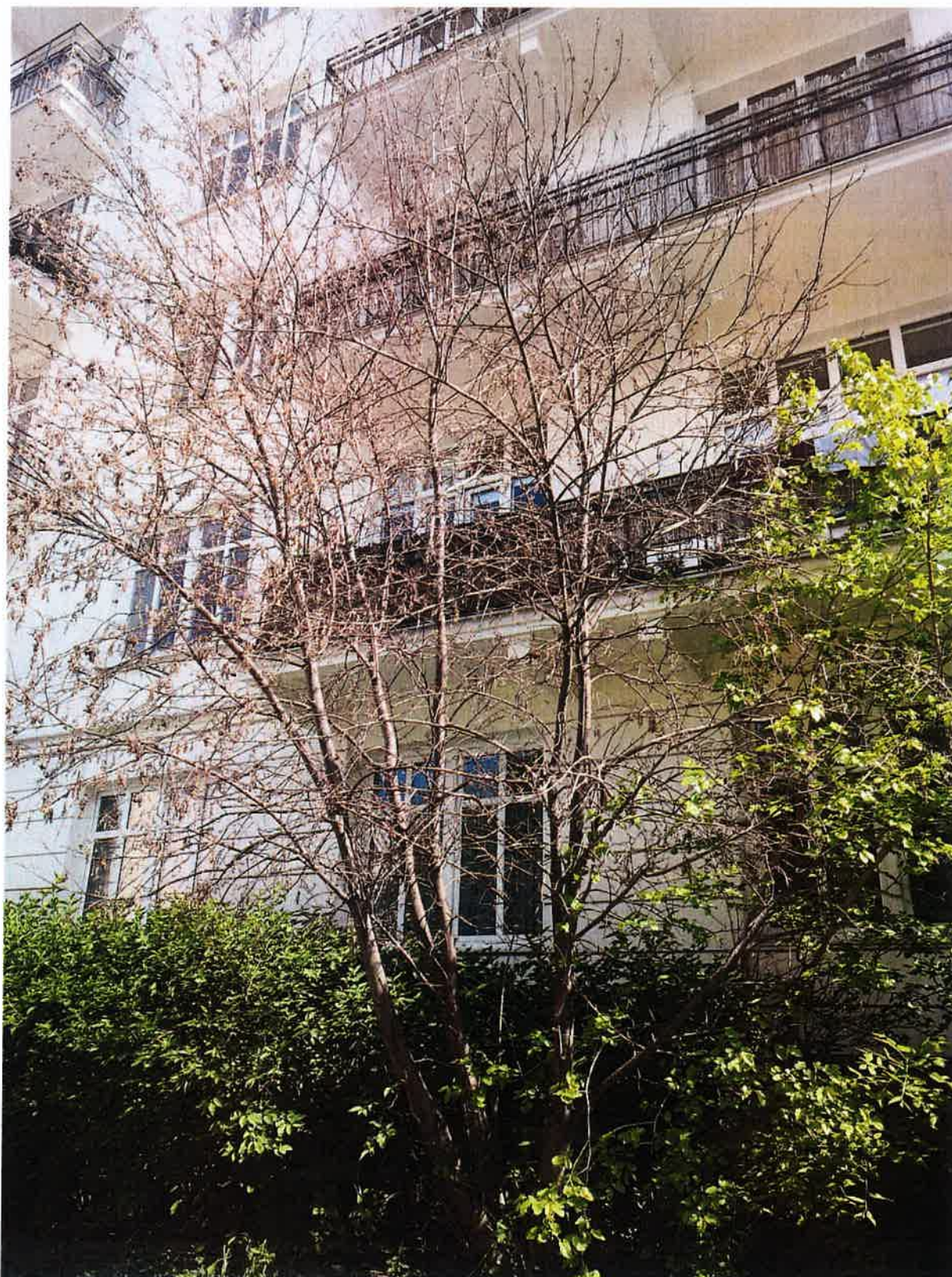
Drzewo do usunięcia – jarzáb pospolity ( Sorbus aucuparia ) – mierz. na wys. 130 cm - 35cm/40cm/49cm

Pas drogowy drogi publicznej ul. Brzeskiej (w sąsiedztwie ul. Białostocka 20) dz. ew. nr 2/1 z obrębu 41405 na terenie Dzielnicy Praga-Północ m.st. Warszawy